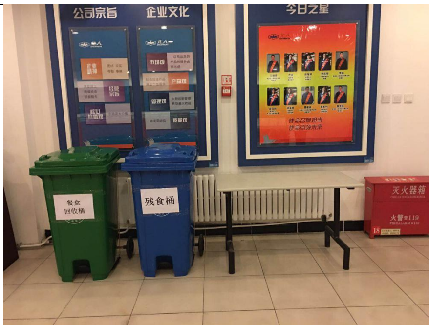
大厅内餐桌及分类垃圾桶